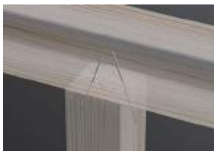
Spoje sloup x vaznice