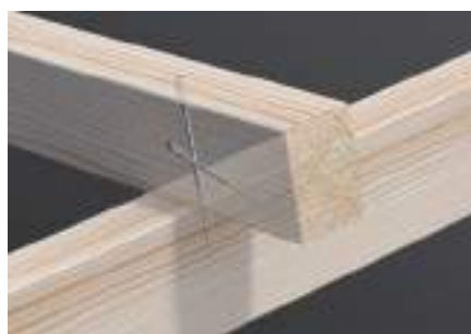
Spoj vaznice x krokve