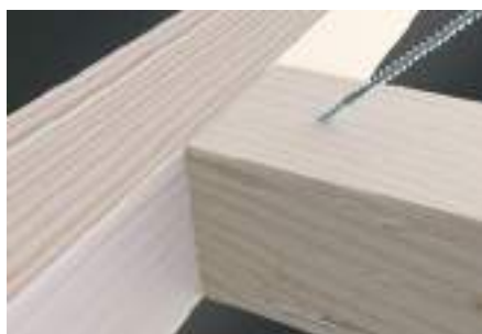
Hlavní a vedlejší nosník