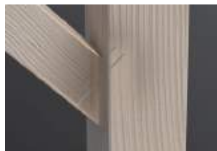
Spoj vzpěra x sloup