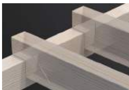
Zesílení v zářezu